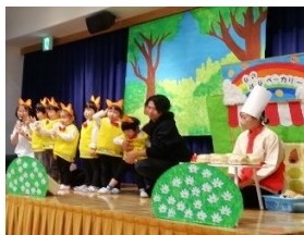
なのはな組 「パン屋さんにお買い物」