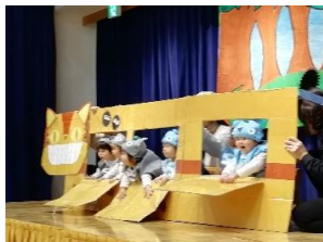
たんぽぽ組 「となりのトトロ」