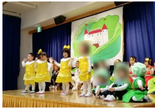
あじさい組 「やさいのパーティー」