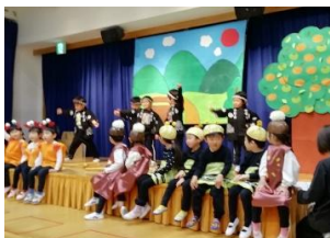
いちよう組「かにむかし」