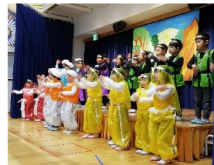
けやき組 「アリババと40人の盗賊」