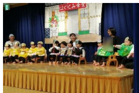
ちゅうりっぷ組「おいしいラーメン召し上がれ」